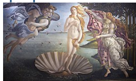
Sandro BOTTICELLI, La Naissance de Vénus , 1484-1485, tempera, 172 x 278 cm, Galerie des Offices, Florence.