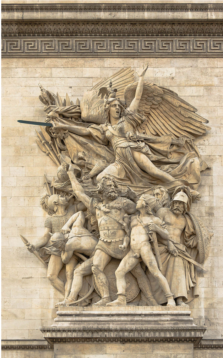
François RUDE (1784-1855), Le Départ des volontaires de 1792, ou La Marseillaise , 1833-36, pierre, 11.6 x 6 m, Arc de Triomphe, Paris.