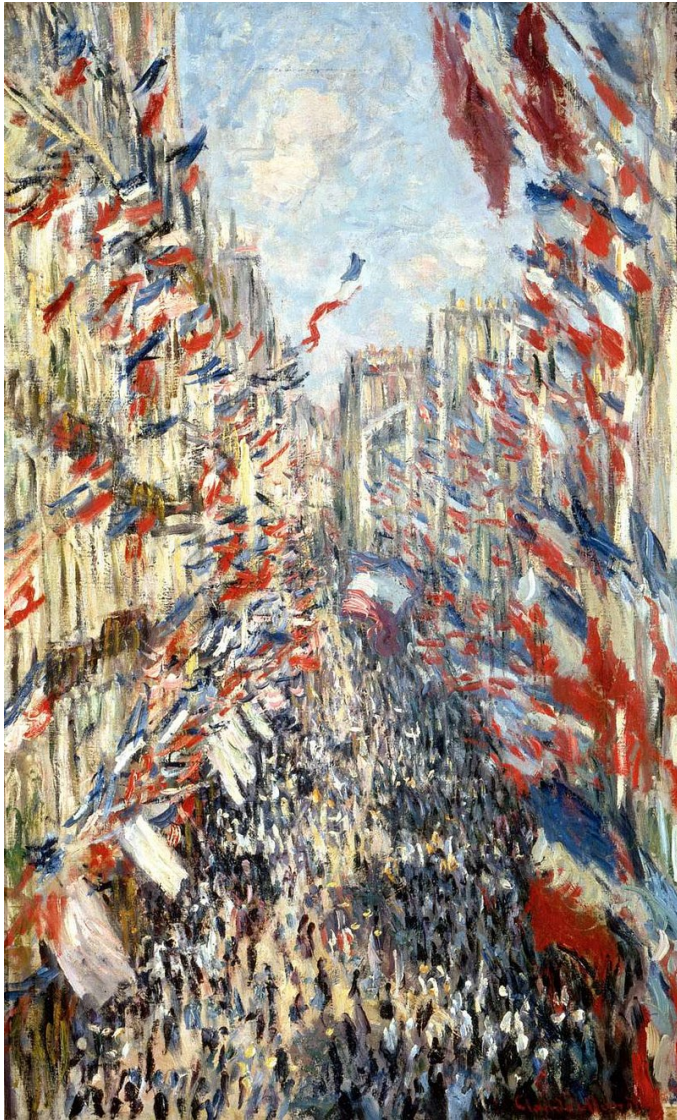
Claude MONET (1840-1926), La Rue Montorgueil , 1878, huile sur toile, 81 x 50 cm, Musée d'Orsay, Paris.

« J'aimais les drapeaux. La première fête nationale du 30 juin, je me promenais rue Montorgueil avec mes instruments de travail; la rue était très pavoisée avec un monde fou. J'avise un balcon, je monte et demande la permission de peindre, elle m'est accordée. Puis je redescends incognito ! » Claude Monet