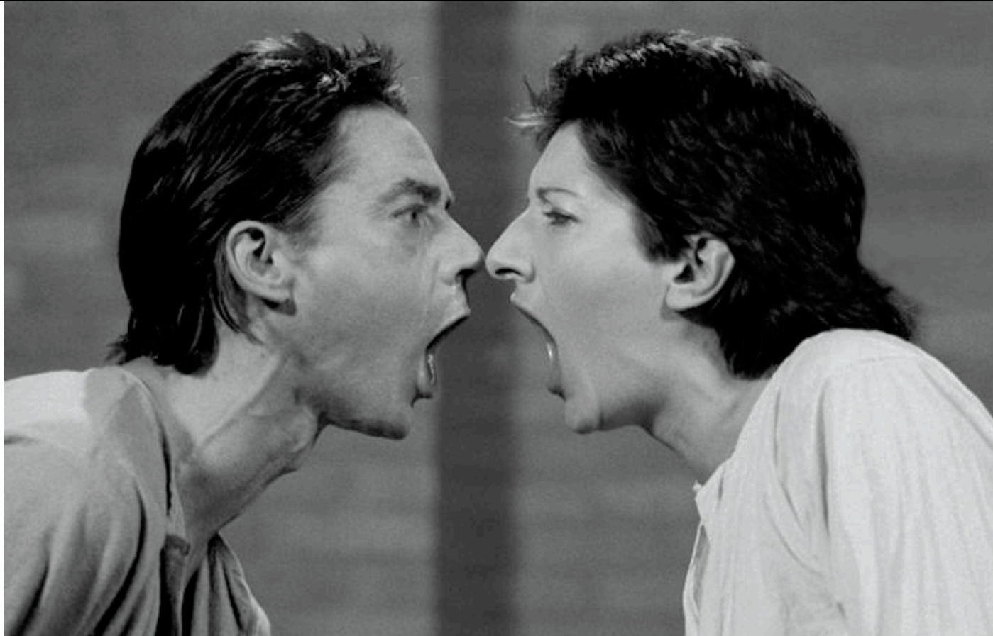
Marina ABRAMOVIC & ULAY, AAA-AAA, 1978