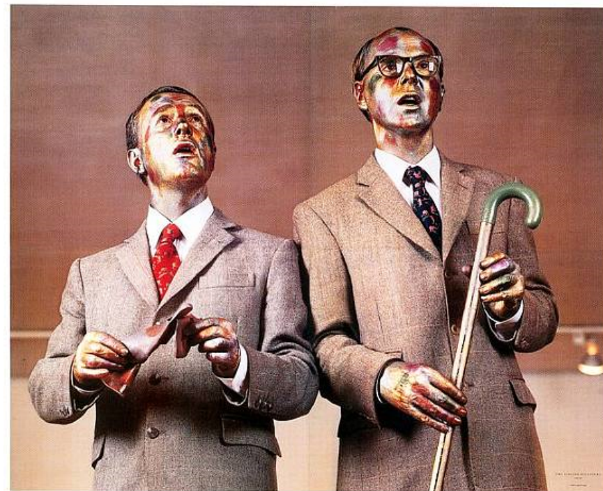
Gilbert & George, Singing sculpture , performance, 1970