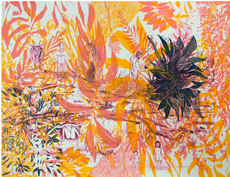
Indigène, 2021 linogravure et pointe sèche, 50x65 cm