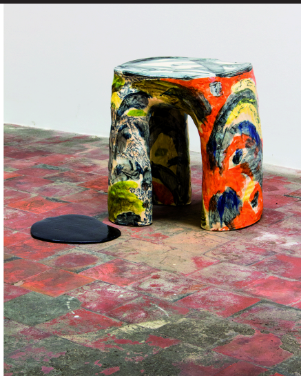
Héloïse Bariol, Trois pieds , 2017, céramique, 46 × 40 × 32 cm.

L'artiste est particulièrement intéressée par... Héloïse Bariol