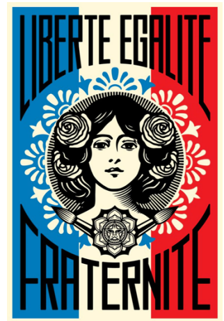
Shepard FAIREY dit OBEY (1970-), Liberté, Égalité, Fraternité , novembre 2015, œuvre street art, fresque monumentale, 186 rue Nationale, Paris 13 e arrondissement réalisée en juin 2016, 15 mètres de hauteur, éditée en sérigraphie offset.

L'artiste associe l'ordre « Obey » (Obéissez) qu'il réalise comme un blason qui est constitué avec des symboles universels, encadré par des pinceaux, symboles de la création artistique et complétés par le visage signature « Obey Giant », celui du lutteur André The Giant. Le visage de la femme est encadré par différents végétaux : des fleurs d'hibiscus, des palmettes, des marguerites, ... Le chiasme est décliné dans Liberté, Égalité, Fraternité , dont le texte de la devise de la République se superpose aux couleurs du drapeau tricolore. La figure hiératique est encadrée par des symboles de vie, de liberté et de création. L'œuvre ici conjugue la figure de Marianne, la devise de la République et le symbole du drapeau tricolore.