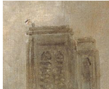
Eugène DELACROIX (1798-1863), La Liberté guidant le peuple , 1830, huile sur toile, 260 x 325 cm, Musée du Louvre, Paris.

Certaines œuvres interrogent la devise républicaine comme étant mises à l'épreuve de l'Art. Shepard Fairey dit OBEY, dans l'œuvre intitulée Liberté, Égalité, Fraternité réalisée en 2015 précise :