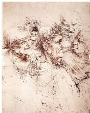
Léonard de VINCI (1452-1519), Étude de cinq têtes grotesques , vers 1494, plume et encre sur papier.

Ce qui relève de la perception et de la liberté de l'Art tend à une dualité qui pose la question de comment prendre position entre magnifier et caricaturer. La caricature, du latin caricare , signifie « charger ». Elle confère ainsi à la personne figurée une exagération des défauts et vient grossir les traits à des fins comiques ou satiriques.