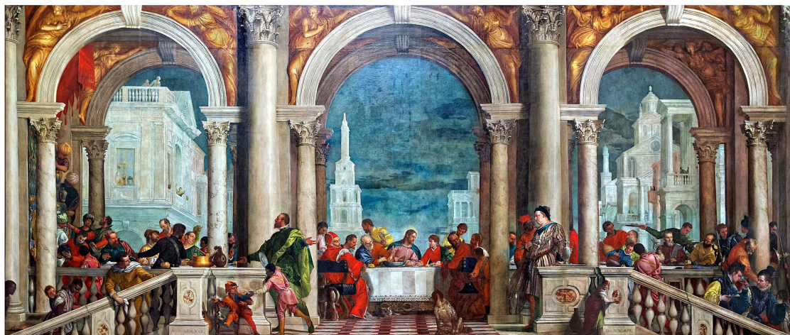
Paolo CALIARI dit VÉRONÈSE (1528-1588), Le Repas chez Levi , 1573, huile sur toile, 555 x 1310 cm, Galleria dell'Accademia, Venise.

Paolo CALIARI dit VÉRONÈSE, 18 juillet 1573 devant le Tribunal du Saint-Office pour l'œuvre La Cène re-titrée Le Repas chez Levi , cité in André CHASTEL, Chronique de la peinture à la Renaissance, 1280-1580 , Éditions Office du Livre/Vilo, Paris, 1983.