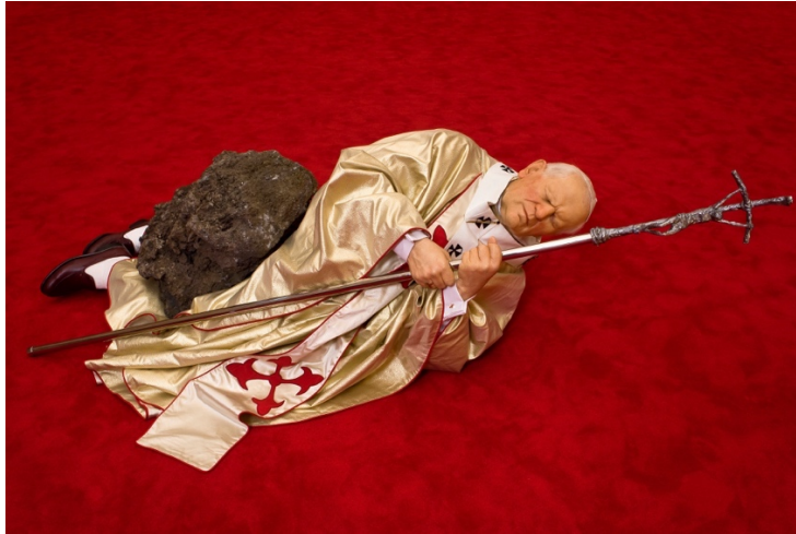
Maurizio CATTELAN (1960-), La Nona Ora , 1999, résine polyester, cheveux naturels, accessoires, pierre volcanique, moquette, dimensions variables, Collection Pinault.