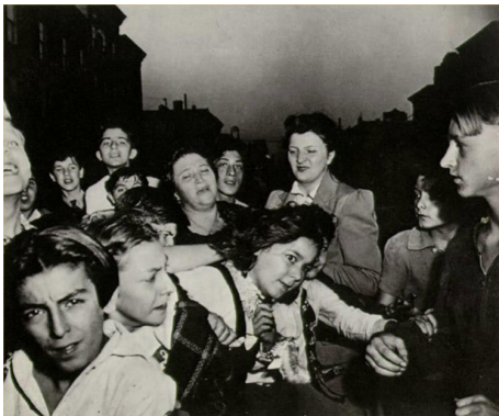
Wee Gee (1889 - 1968) leur premier meurtre, 1936