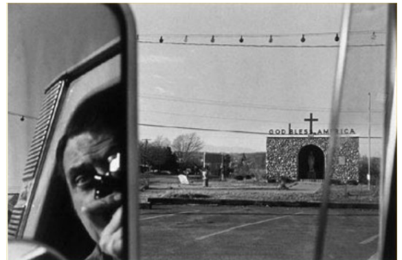
Lee Friedlander, (1934 - ...) Route 9 W, N Y, 1969