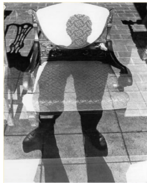
Lee Friedlander (1934 - ...) Wilmington Delaware, 1965