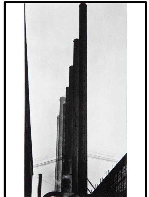
Edward Weston (1888 - 1956), Armco steel, Ohio , 1922