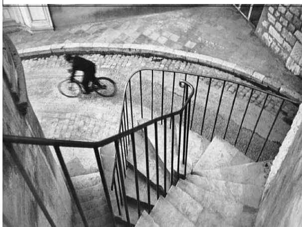
Henri Cartier-Bresson (1908-2004), Hyerès , 1932

Le photographe se place en dessous de son sujet, ce qui accentue l'effet de hauteur.