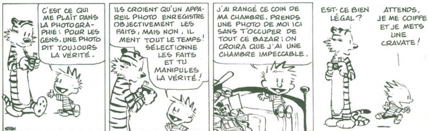
Bill Watterson, Calvin et Hobbes