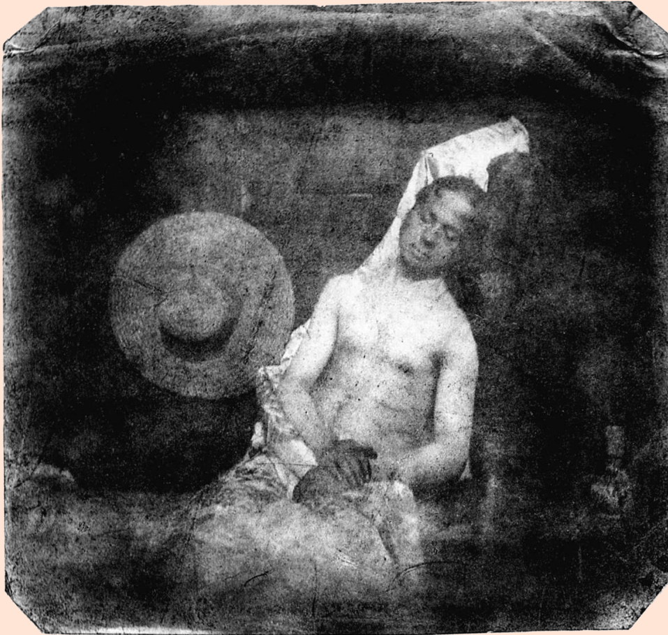
Hippolyte Bayard, autoportrait dit du "Noyé" et légende au dos, octobre 1840.

Daguerre a dit ne rien pouvoir faire pour M. Bayard et le malheureux s'est noyé. Oh ! instabilité des choses humaines ! Les artistes, les savants, les journaux se sont occupés de lui depuis longtemps et aujourd'hui qu'il y a plusieurs jours qu'il est exposé à la morgue personne ne l'a encore reconnu ni réclamé. Messieurs et Dames, passons à d'autres, de crainte que votre odorat ne soit affecté, car la figure du Monsieur et ses mains commencent à pourrir comme vous pouvez le remarquer. »