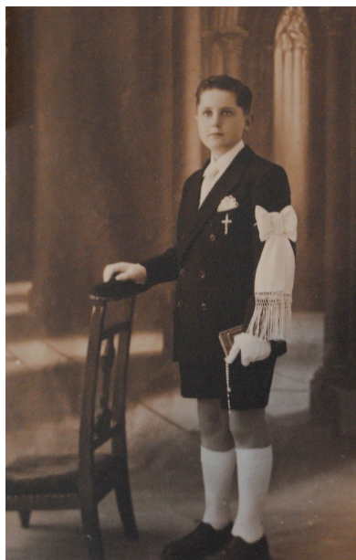
photo anonyme de communicant

L'idée est de donner de vous une image la plus éloignée possible de qui vous êtes, vraiment.