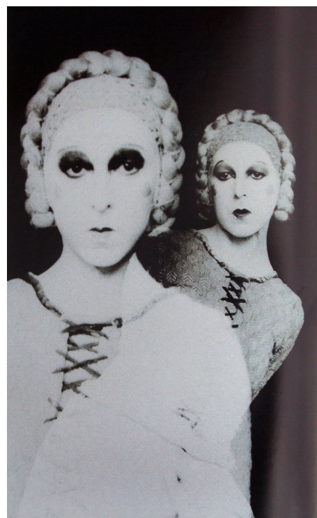
Claude Cahun, autoportraits , vers 1930. Différentes figures et différents genres... lequel est le vrai? Y en a t il un vrai? N'y en a t il qu'un vrai?