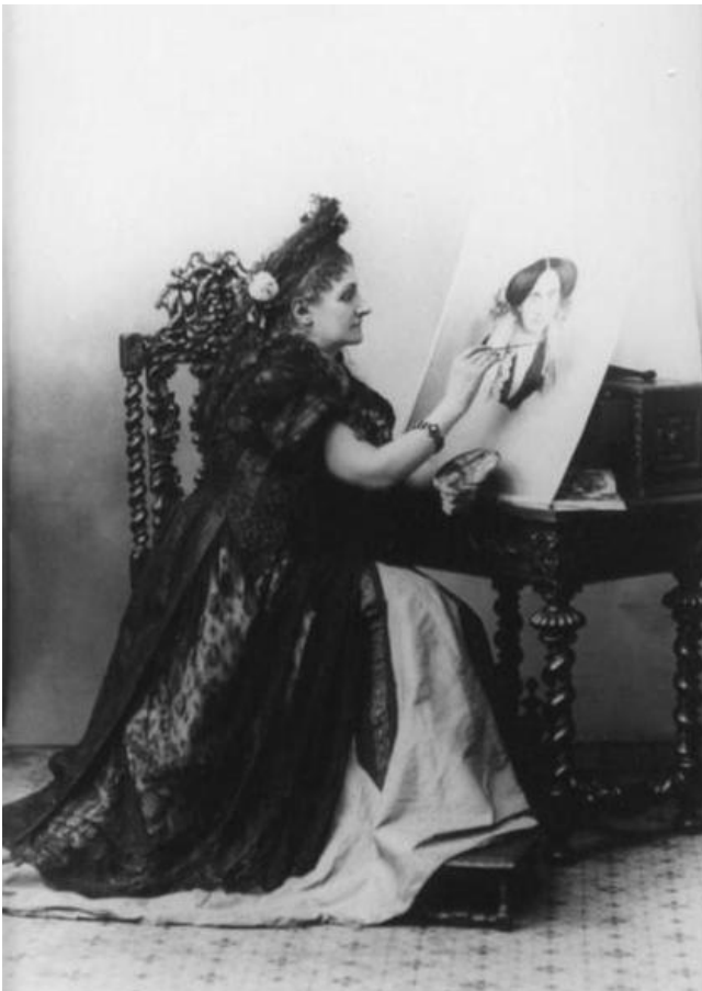
Pierson, 1863 Virginia de Castiglione.

Suivre ensuite l'histoire assez dingue de cette femme du monde du XIXeme siecle, la Comtesse de Castiglione, connue pour qui elle n'était pas, et reconnue à présent comme une artiste novatrice: https://plume-dhistoire.fr/la-castiglione-ses-photos-fascination-et-modernisme/