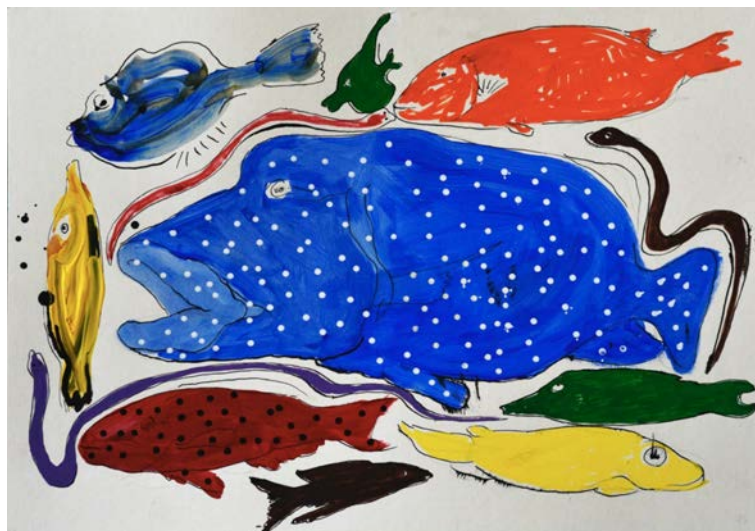
Poissons, acrylique et encre de chine sur carton, 30,5 x 43cm

sont heureuses de vous convier au vernissage de l'exposition en présence de l'artiste