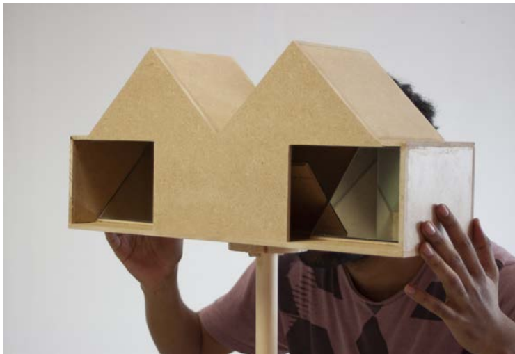
Machine vision #3, 2021 bois, MDF, miroir, 50x25x15 cm, sur pied 170 x 30 x 30 cm

sont heureuses de vous convier au vernissage de l'exposition en présence de l'artiste